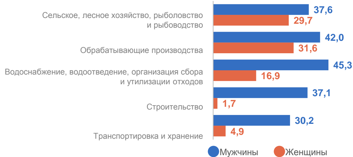
Удельный вес мужчин и женщин, получающих компенсации по видам деятельности, ТОП – 5, тыс. человек