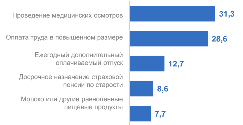
Работники, получающие компенсации за работу с вредными условиями труда, ТОП – 5, тыс. человек